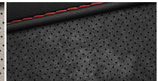
Leder-/Alcantara Kombination 9) N Line