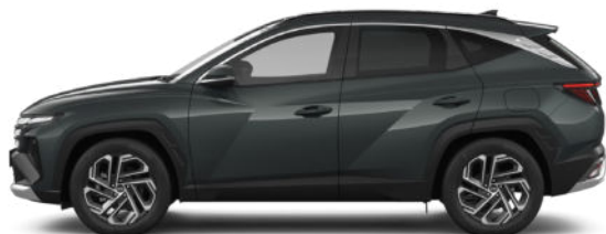
Cypress Green Pearl Kontrastdach verfügbar nicht für N Line verfügbar