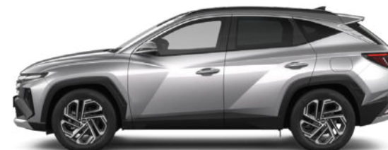
Shimmering Silver Metallic Kontrastdach verfügbar