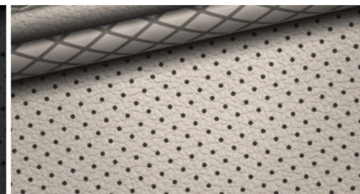
Lederinnenausstattung 8) hellgrau