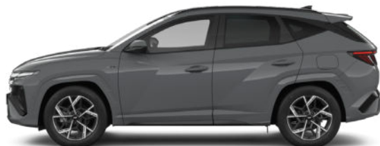
Shadow Grey Kontrastdach verfügbar nur für N Line verfügbar