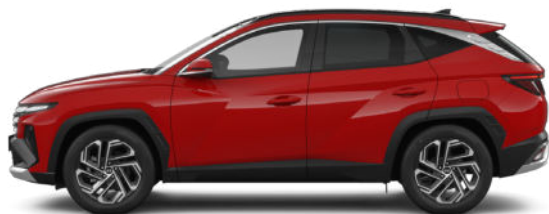
Engine Red Kontrastdach verfügbar