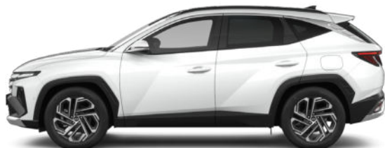
Serenity White Pearl Kontrastdach verfügbar