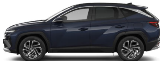
Sailing Blue Pearl Kontrastdach verfügbar nicht für N Line verfügbar