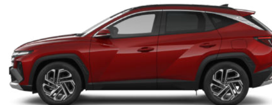
Ultimate Red Metallic Kontrastdach verfügbar