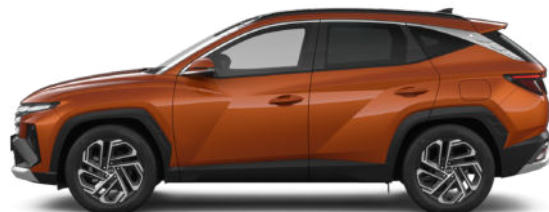
Jupiter Orange Metallic Kontrastdach verfügbar nicht für N Line verfügbar