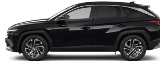
Abyss Black Pearl